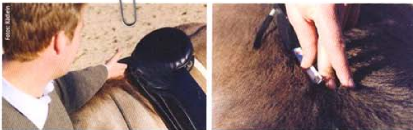
Über dem Widerrist sollten beim aufgesessenen Reiter etwa vier Finger Platz haben (links). Das Maß allein sagt nichts über die Passform. Rechts: Von Messpunkt 3 geht's zu Messpunkt 2.