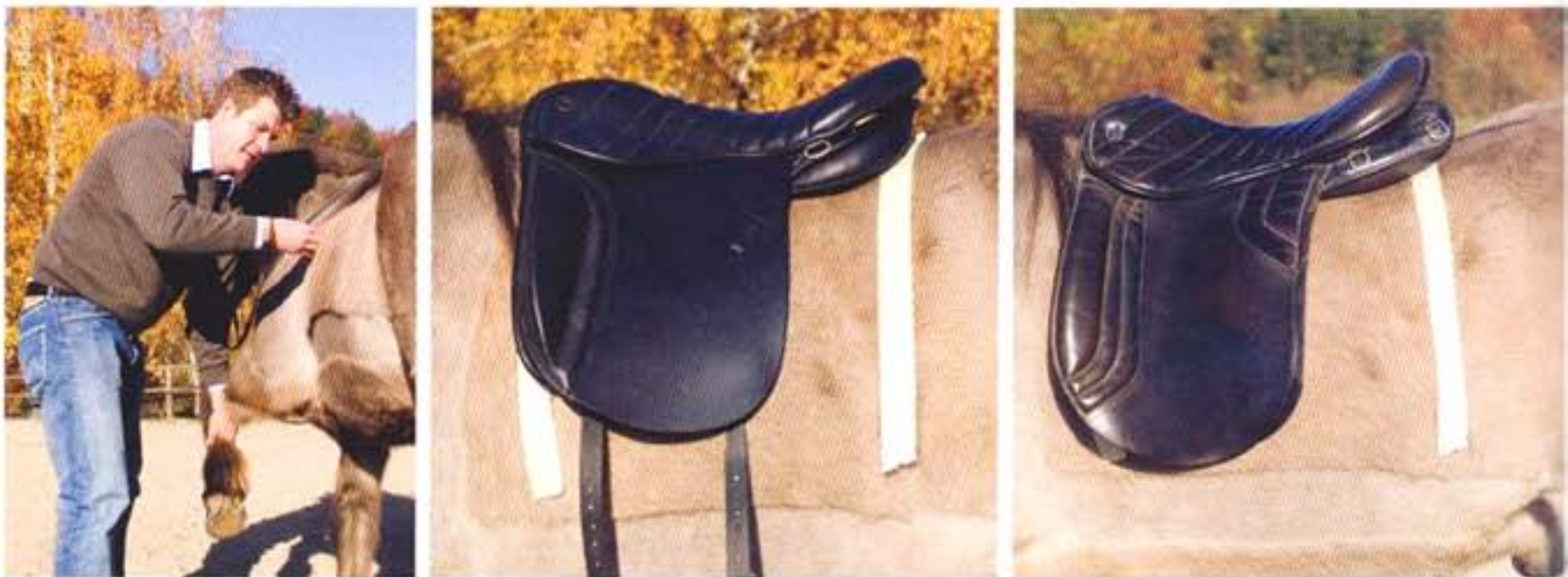
Ein Anheben des Beins wie beim Tölt zeigt, wo das Sattelblatt liegen muss (links). Das Klebeband markiert die Sattellage. Optimal liegt der Töltsattel (Mitte). Der Trachtensattel auf dem selben Pferd (rechts) drückt gegen die Schulter und ragt in den Lendenbereich.

Auch ermöglicht der Sattel im Gelände den leichten Sitz. Deshalb nutzen viele Freizeitreiter die Potrera für Ausritte und zum Dressurreiten. ▶▶